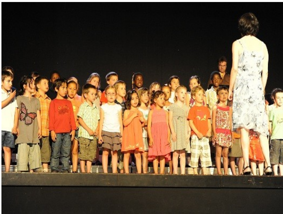
« Les écoles de Cugnaux chantent » Année scolaire 2010/2011 – Salle Albert Camus