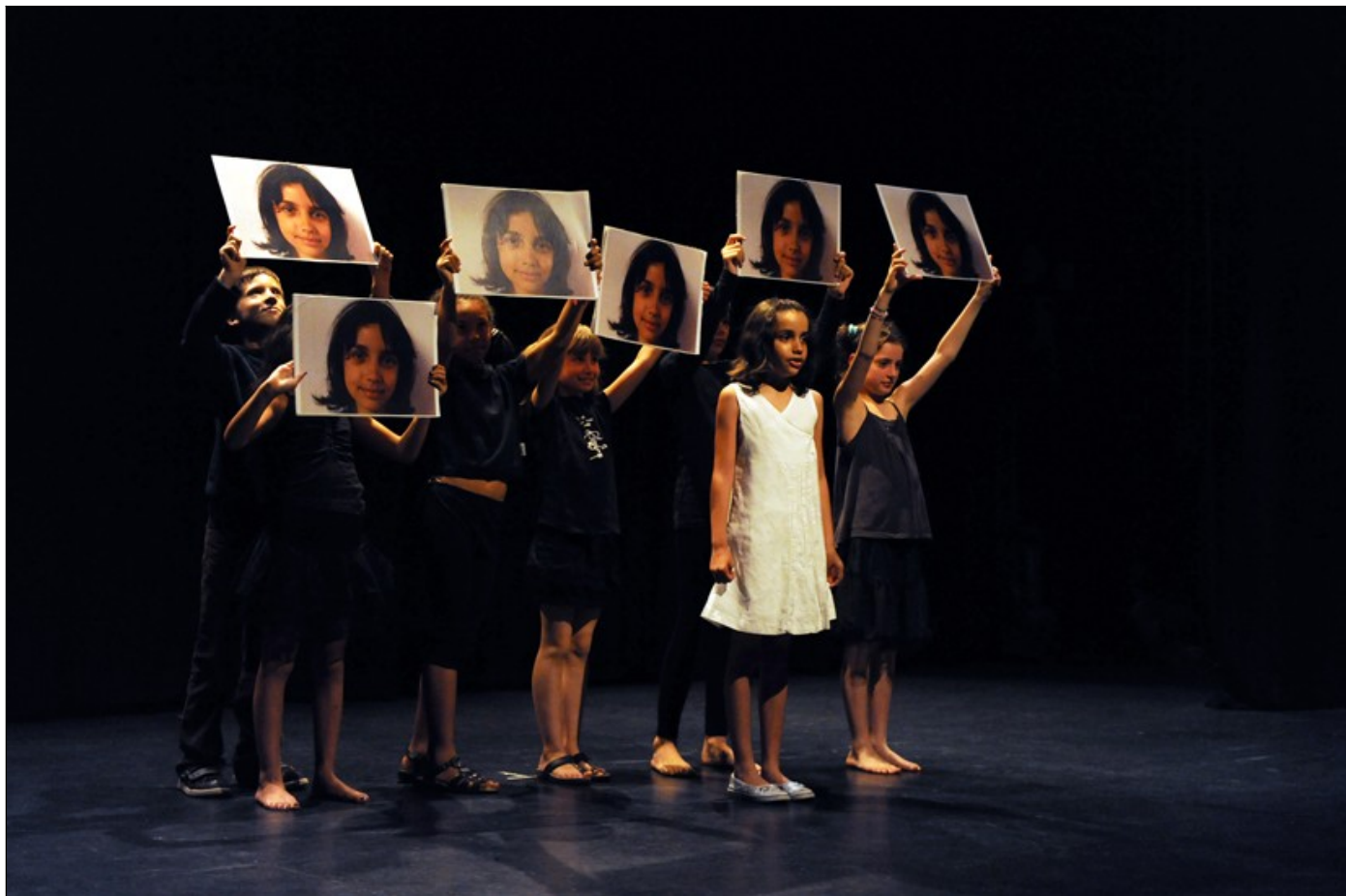
Atelier théâtre EMEA – Bilbo – Histoires pressées de Bernard Friot