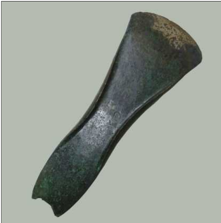
Hache en bronze, âge du Bronze moyen, dépôt d'Arnave (Ariège), Musée Saint-Raymond, Musée des Antiques de Toulouse

Pré-histoires à Villeneuve-Tolosane/Cugnaux I