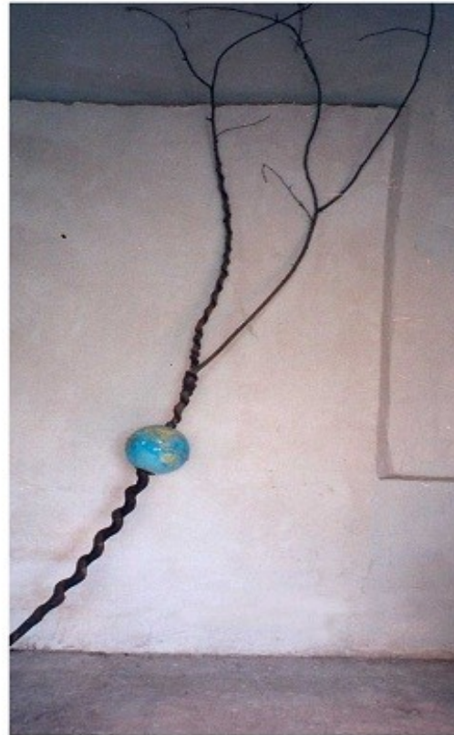
Le mouvement de la terre 2