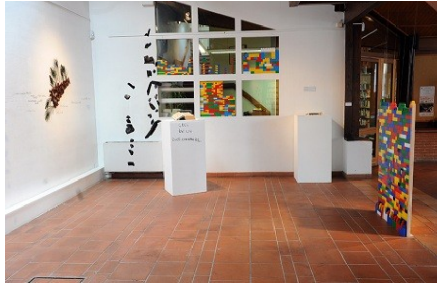
Exposition « Les archéologues du futur » Année scolaire 2010/2011 - Espace Paul Éluard

L'exposition « Les archéologues du futur II » restitue les travaux des classes inscrites au parcours Art et Archéologie. Ce projet d'éducation artistique conduit par Fanny Delpech ( intervenante en arts visuels ), s'appuie sur les trois grandes expositions de la saison arts visuels de la Ville de Cugnaux :