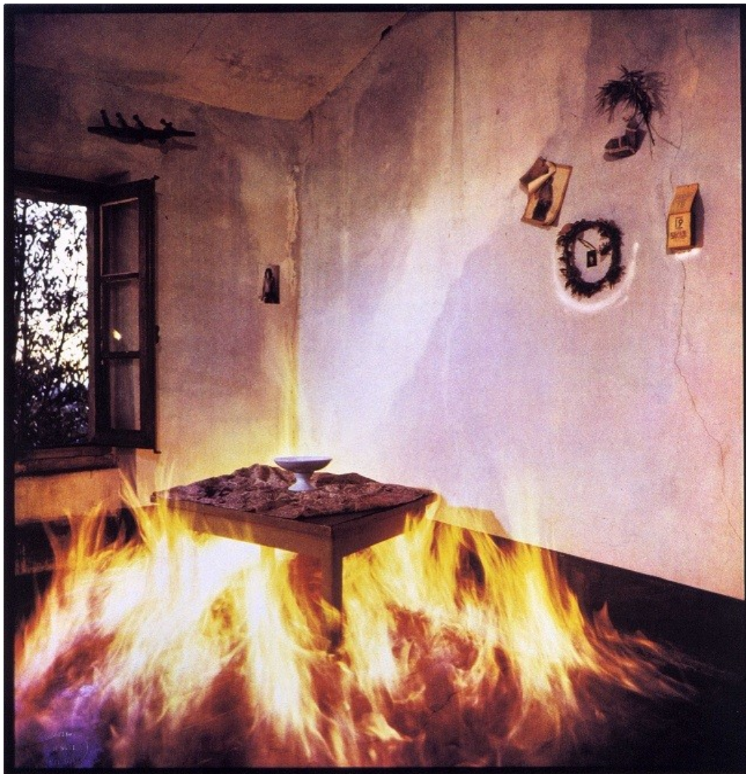
La chambre qui brûle, Collection des Abattoirs Toulouse © Bernard Faucon

Dans la mythologie greco-latine, l'âge d'airain ou du bronze marque le début des excès et des crimes de l'humanité : Les hommes devenus féroces ne respiraient que la guerre (Ovide). Faisant suite à l'exposition archéologique sur l'âge du bronze, À l'épreuve du feu présente des œuvres d'art contemporain où le recours au métal, l'image du feu, la représentation des armes et de l'érosion évoquent à la fois le désordre et le chaos de cet âge de l'humanité mais aussi le principe régénérateur de ces éléments pour une évolution probable du temps.