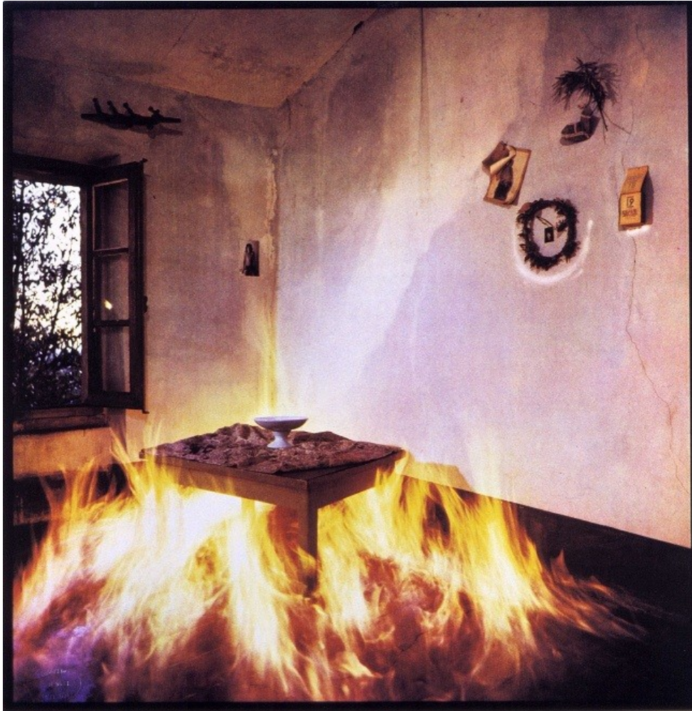
La chambre qui brûle, Collection des Abattoirs Toulouse © Bernard Faucon

Œuvres de la Collection du Musée des Abattoirs et du Frac Midi-Pyrénées