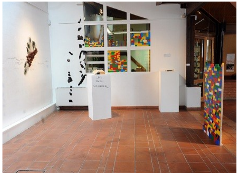
Exposition « Les archéologues du futur » Année scolaire 2010/2011 - Espace Paul Éluard

L'exposition « Les archéologues du futur II » restitue les travaux des classes inscrites au parcours Art et Archéologie. Ce projet d'éducation artistique conduit par Fanny Delpech ( intervenante en arts visuels ), s'appuie sur les trois grandes expositions de la saison arts visuels de la Ville de Cugnaux :