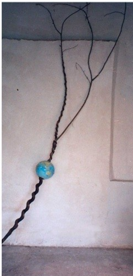
Le mouvement de la terre 2