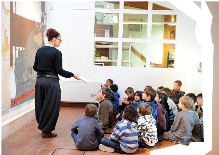
Visite exposition Néo-Cugnaux II – classe de Mme ROSSIGNOL – élémentaire Jean Jaurès Année scolaire 2010/2011 - Espace Paul Éluard