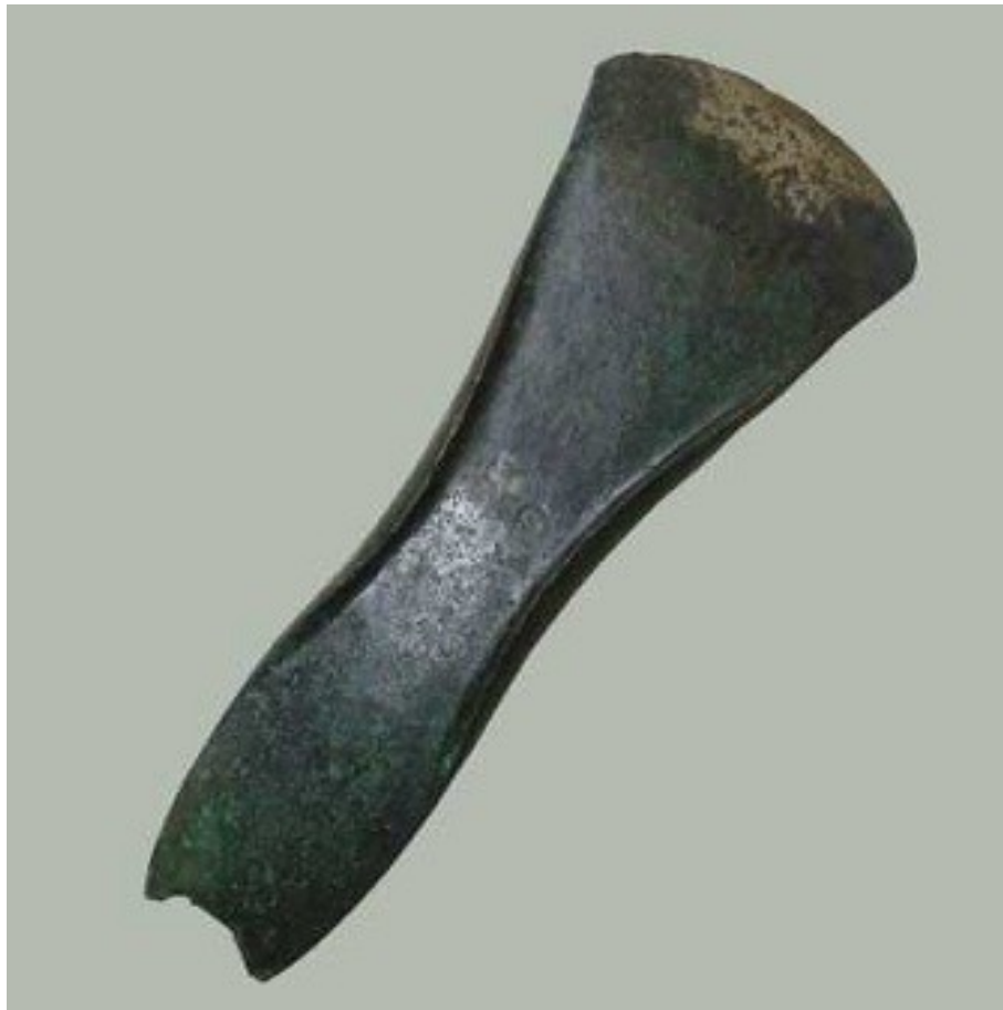
Hache en bronze, âge du Bronze moyen, dépôt d'Arnave (Ariège), Musée Saint-Raymond, Musée des Antiques de Toulouse

Pré-histoires à Villeneuve-Tolosane/Cugnaux I